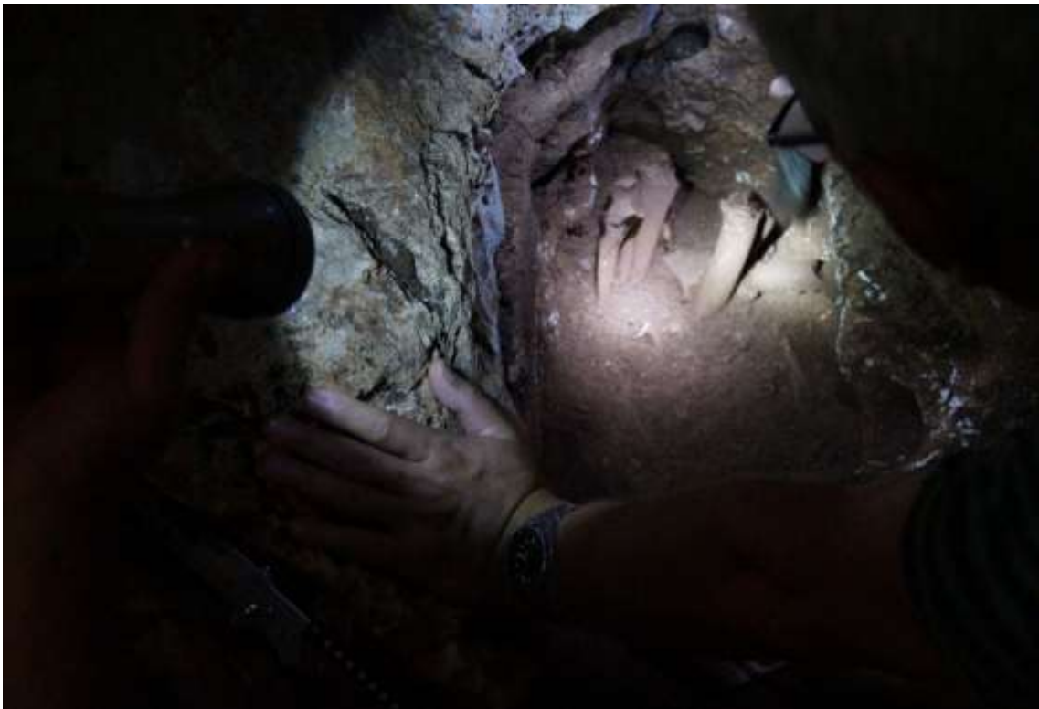
Entierro aborígen en Cueva Vigía

A 3 km de la comunidad La Picadora se encuentra la Cueva Vigía, donde fortuitamente campesinos de la localidad encontraron evidencias de restos óseos pertenecientes a aborígenes cubanos. Se efectuó una visita a la cueva donde participó además un antropólogo forense, encargado de analizar los restos óseos que desde hacía algún tiempo se habían reportado.