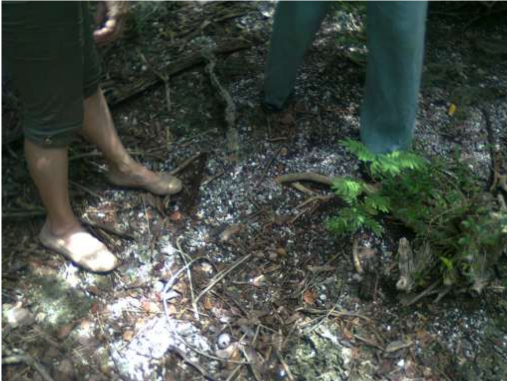
Conchales con evidencias de dieta aborigen