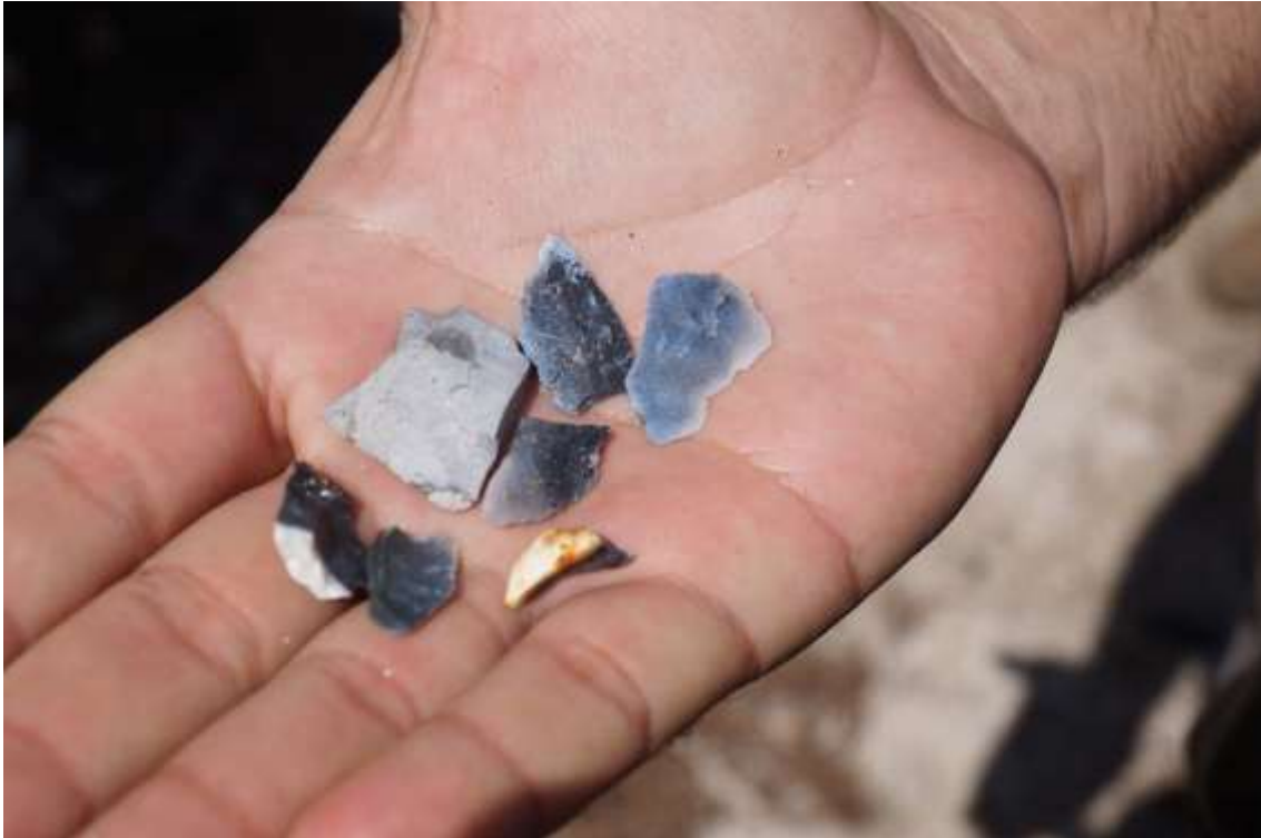
Piezas arqueológicas de sílex encontradas a la orilla del sitio Playa Carbó