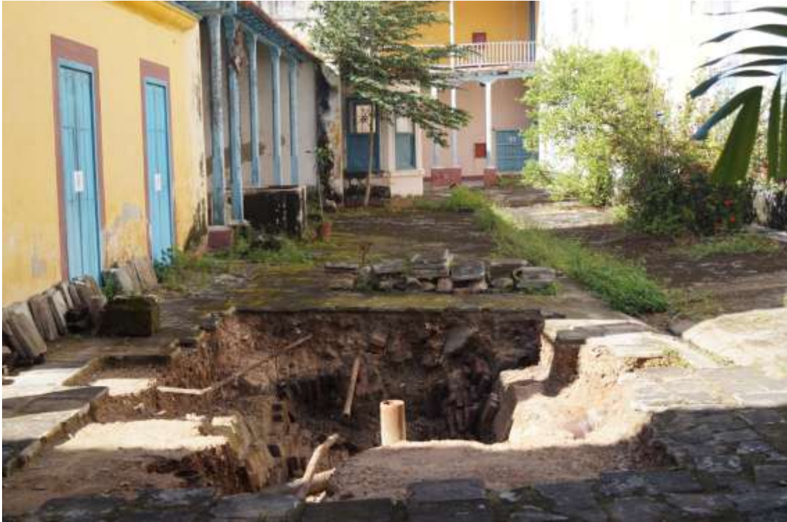
Visita a la excavación realizada en el Convento de Santa Clara