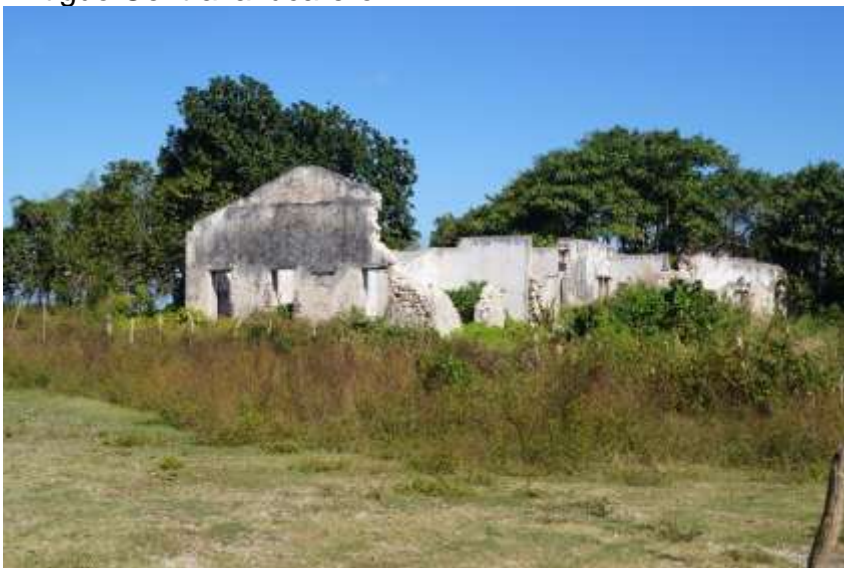
Antiguo barracón de esclavos

Con el arqueólogo José Eusebio Chirino Camacho, del Departamento de Estudios Arqueológicos y Paleontológicos de Yaguajay, se efectuó una visita al litoral norte, específicamente a Playa Carbó. Las poblaciones aborígenes que se asentaron allí, pertenecían a las culturas agricultoras-ceramistas y vivían en construcciones de maderas en el mar, sobre palafitos. Debido a la influencia de los vientos y las corrientes marinas solo se ven los palafitos cuando baja la marea. En la orilla de la costa se pueden apreciar abundantes fragmentos de sílex y cerámica.