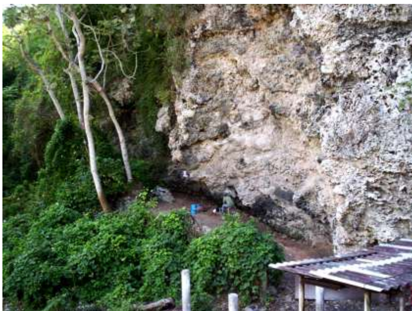
Sitio arqueológico Canímar Abajo

Este sitio prehispánico se ubica en las márgenes del río Canímar, al norte de la provincia de Matanzas. En él se han realizado excavaciones por parte de investigadores del Museo Antropológico Montané y de otras instituciones cubanas, desde la década de los ochenta y hasta la actualidad. Cuenta con numerosos enterramientos de individuos adultos y subadultos de los aborígenes llamados tradicionalmente recolectores-pescadores-cazadores, quienes además tenían agricultura incipiente. El sitio se destaca por su antigüedad y se encuentra en un área que por sus valores naturales fue declarada Monumento Nacional en el año 2010. El cementerio aborígen se localiza debajo de un farallón rocoso.