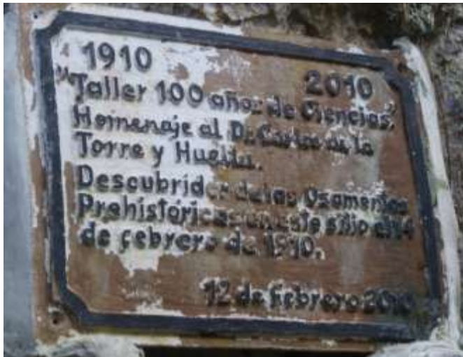
Tarja conmemorativa en Las Llanadas