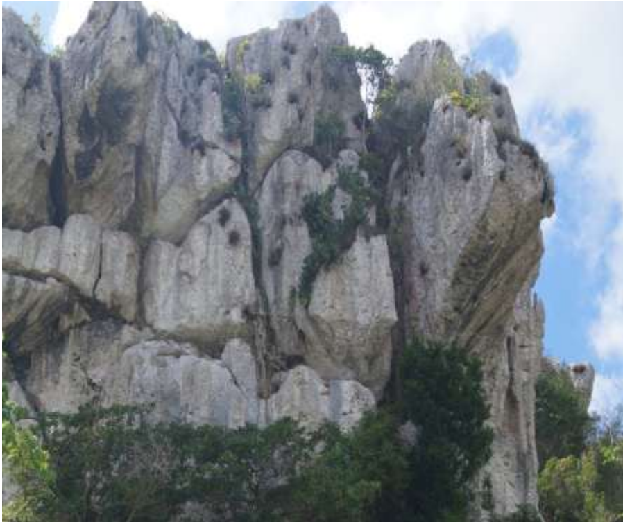
Cueva Evaristo, municipio Yaguajay