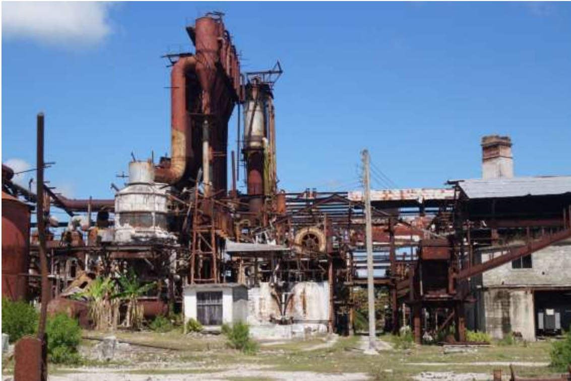
Antiguo Central azucarero