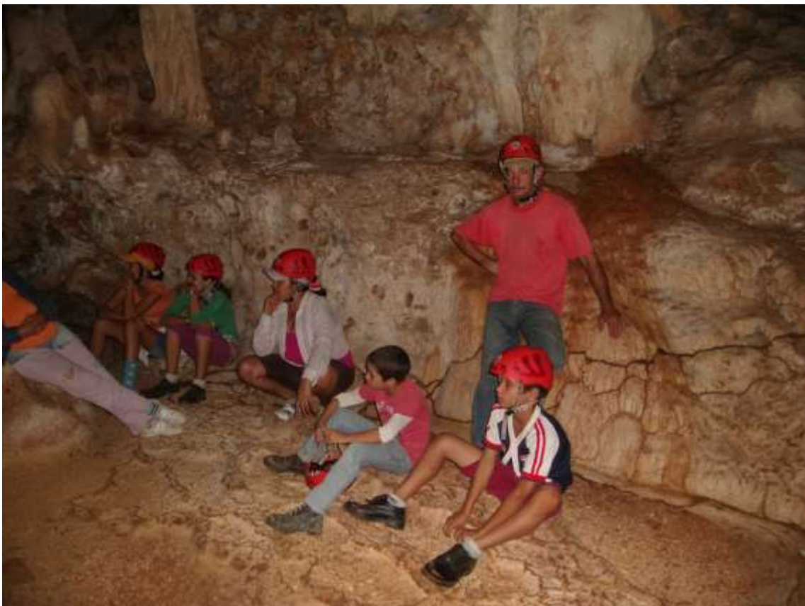
Miembros de la comunidad en el complejo Cavernario del Parque Nacional Caguanes

El Parque Nacional Caguanes se encuentra al noreste de la provincia Sancti Spíritus. Está constituido por aproximadamente 79 cuevas. Su flora y fauna tienen alto grado de endemismo a nivel nacional, regional y local. Es un área protegida y fue declarado por la UNESCO reserva de la Biosfera. Este sitio fue habitado hace más de 2000 años y tiene alto valor patrimonial y arqueológico, con abundantes pictografías aborígenes.