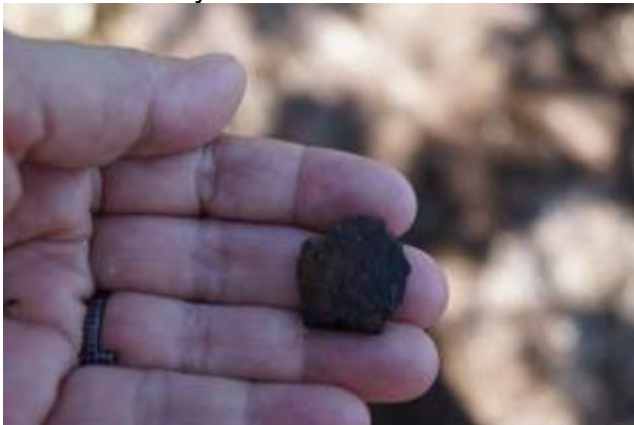
Piezas arqueológicas de cerámica encontradas a la orilla del sitio Playa Carbó