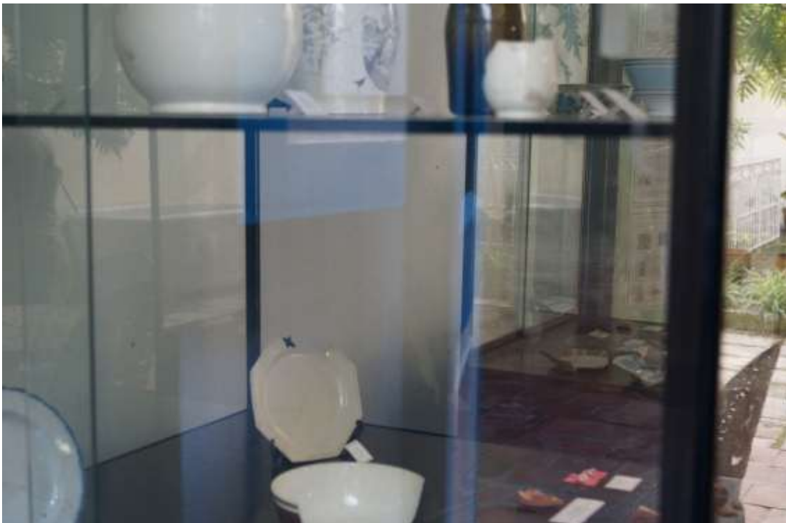
Gabinete de Arqueología. Oficina del Historiador de la Ciudad, Habana Vieja

El convento de Santa Clara de Asís abarca cuatro manzanas que delimitan las calles Cuba, Sol, Luz y Habana. En el siglo XVIII, tuvo iglesia, tres claustros y un huerto.