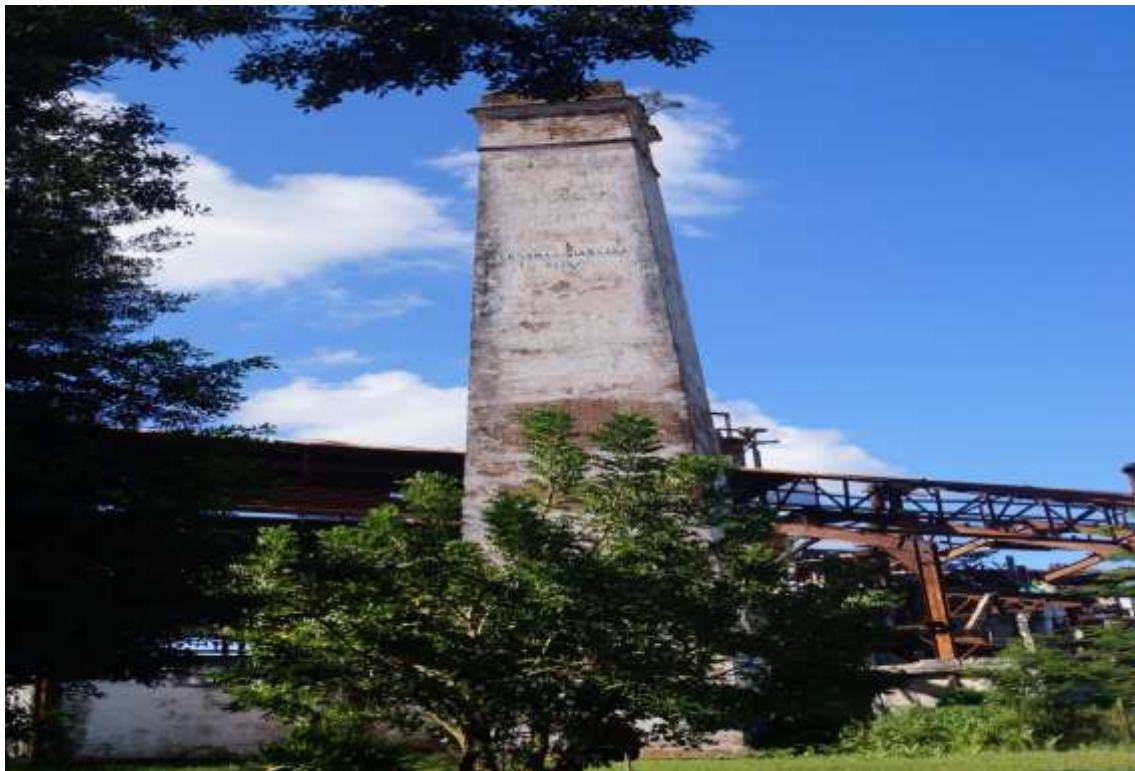
Torre del central Narcisa

Se realizó un recorrido por antiguos centrales azucareros, como una experiencia de arqueología industrial, pues el municipio antes del año 2003 era una zona eminentemente azucarera. Para contar con evidencias fotográficas del importante patrimonio material relacionado con la cultura del azúcar, se fotografiaron torres, centrales azucareros y un antiguo barracón de esclavos.