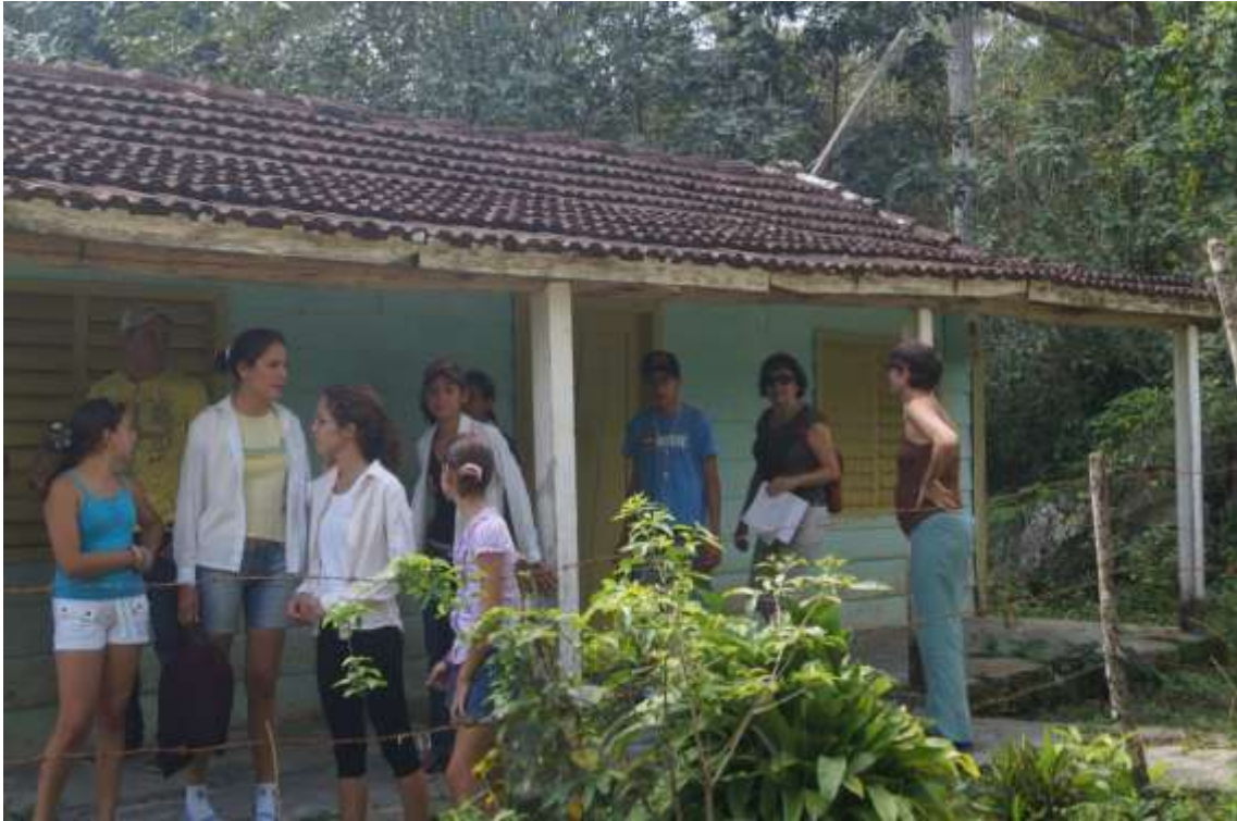
Casa de un campesino que se ubica en la entrada al sitio Las Llanadas