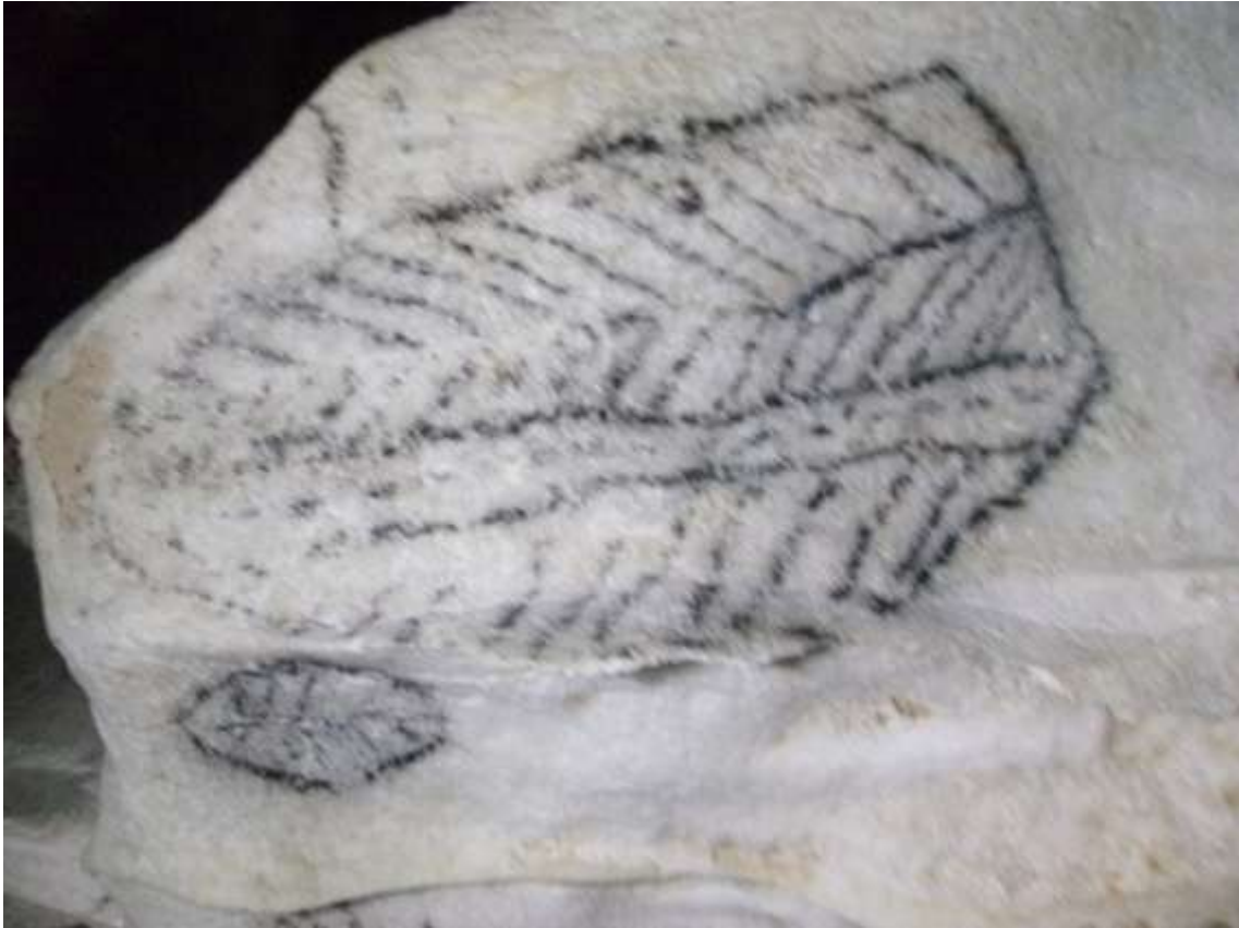
Pictografía aborigen en el Parque Nacional Caguanes