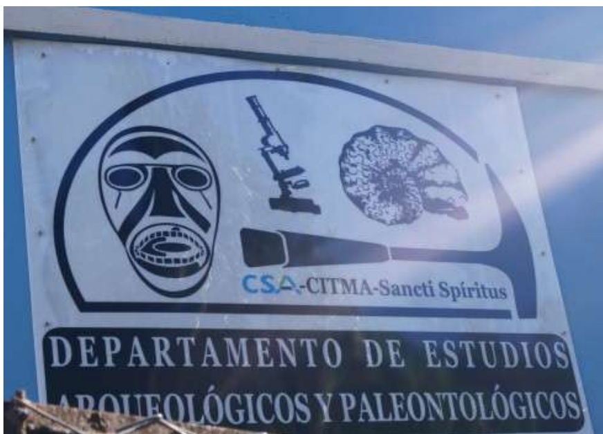
Cartel ubicado a la entrada del Departamento de Estudios Arqueológicos y Paleontológicos en Yaguajay.

El municipio Yaguajay, pertenece a la provincia Sancti Spíritus, en el centro de Cuba. El primer lugar visitado fue el Departamento de Estudios Arqueológicos y Paleontológicos del territorio, que cuenta con un mapa de los asentamientos prehispánicos de la región.