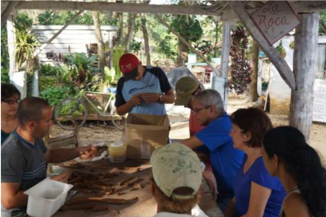
Procesamiento del material osteológico encontrado en la Cueva Vigía